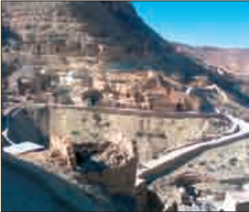
مسلك سياحي بشنني