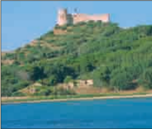
الحصن الجنوبي بطبرقة