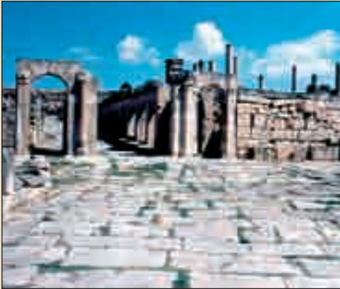
الموقع الأثري بموستي – Musti الكريب