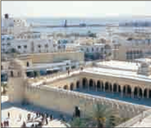
الجامع الكبير بسوسة