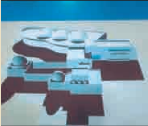
متحف جربة للتراث التقليدي