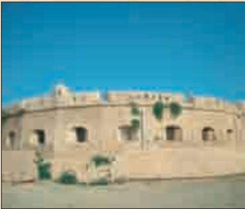
البرج الفوقاني بغار الملح