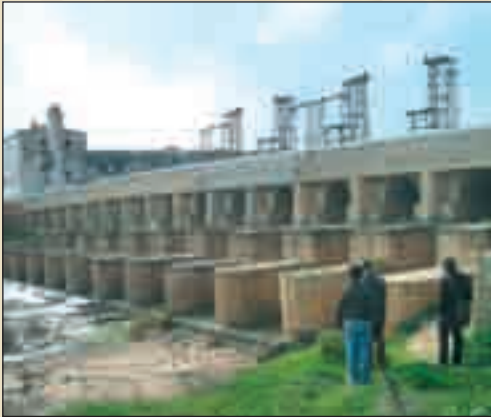
جسر وسد البطان