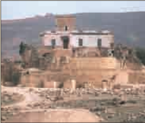
معبد الكابيتول - أوزنة