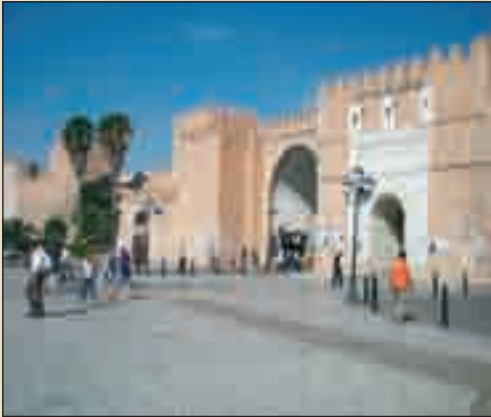
باب الديوان - مدينة صفاقس