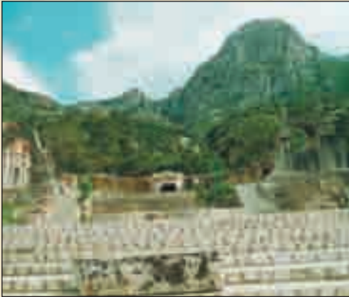
معد المياه بزغوان