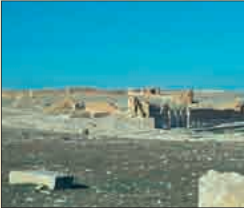
الحصن البيزنطي - حيدرة