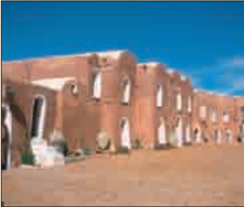
قصر أولاد دباب – تطاوين