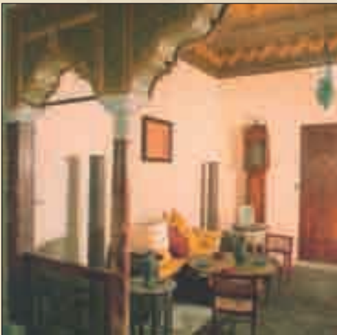
قصر النجمة الزهراء