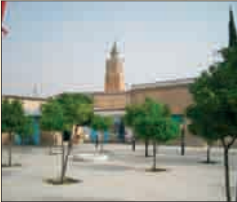
الساحة العمومية - تستور