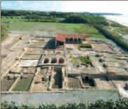
موقع نيابوليس - نابل