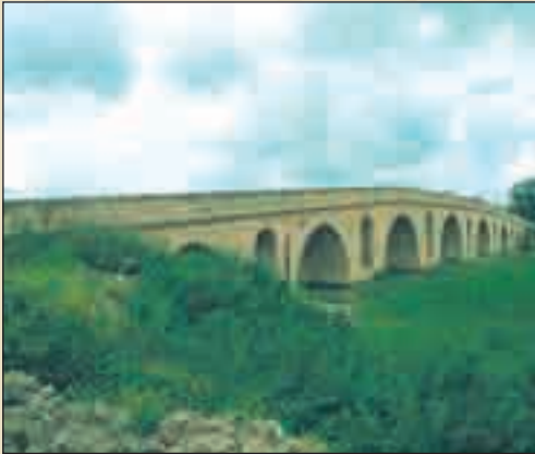
قتطرة بنزرت – قلعة الأندلس