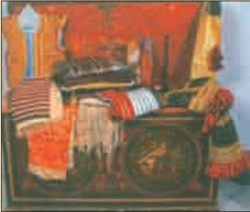
لباس وأثاث تقليدي بالمهدية