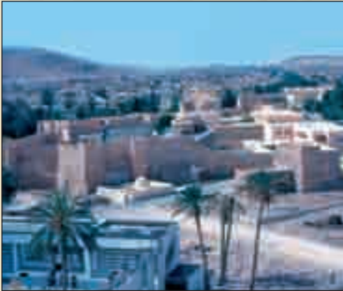
القفصة - مدينة قفصة