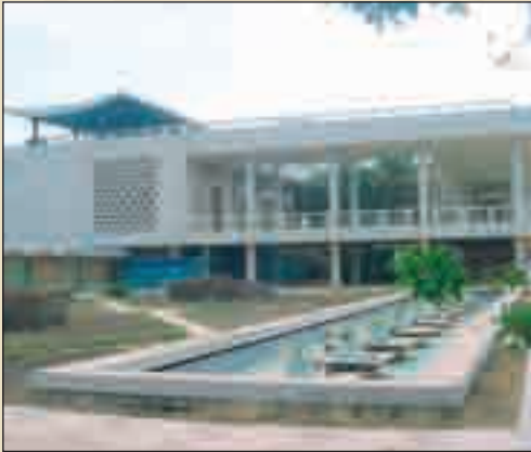
قصر سقانس بالمنستير