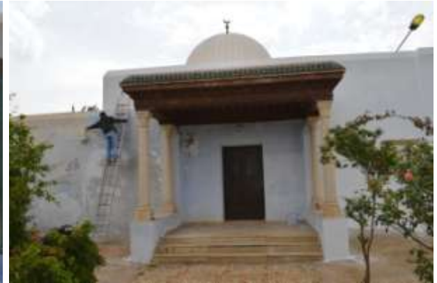
دهن وتبييض لكامل المعلم