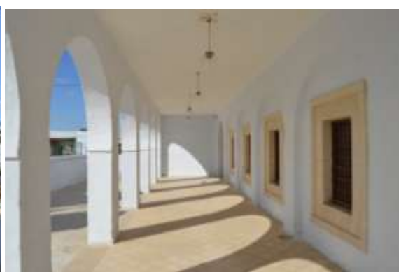
صور عامة للأروقة