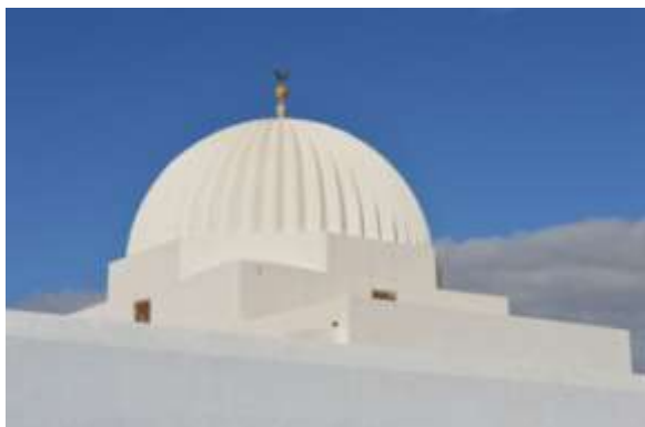
القبة بعد الأشغال