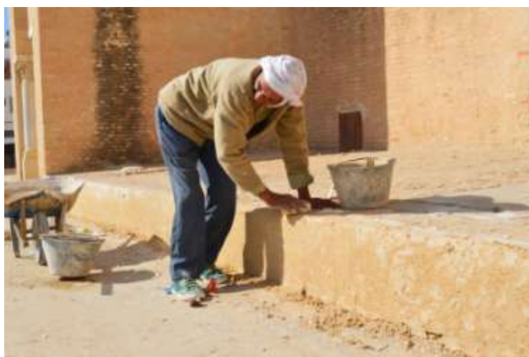
تمليس الطبقة النهائية للملاط