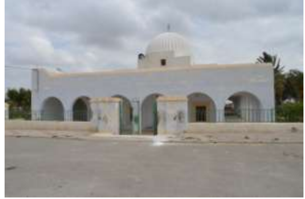
الواجهة الرئيسية قبل الأشغال