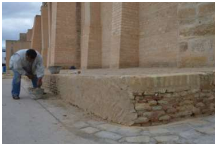
إعادة بناء الأجزاء المفقودة