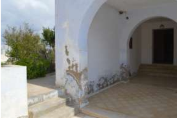
تأثر الجدران من جراء الرطوبة