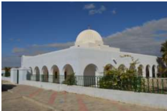
المنظر العام للمعلم بعد الصيانة