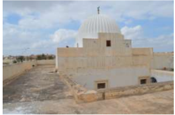
حالة الأسطح والقبة قبل الصيانة