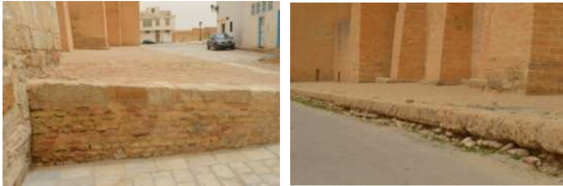
تآكل بعض الأجزاء بفعل الرطوبة