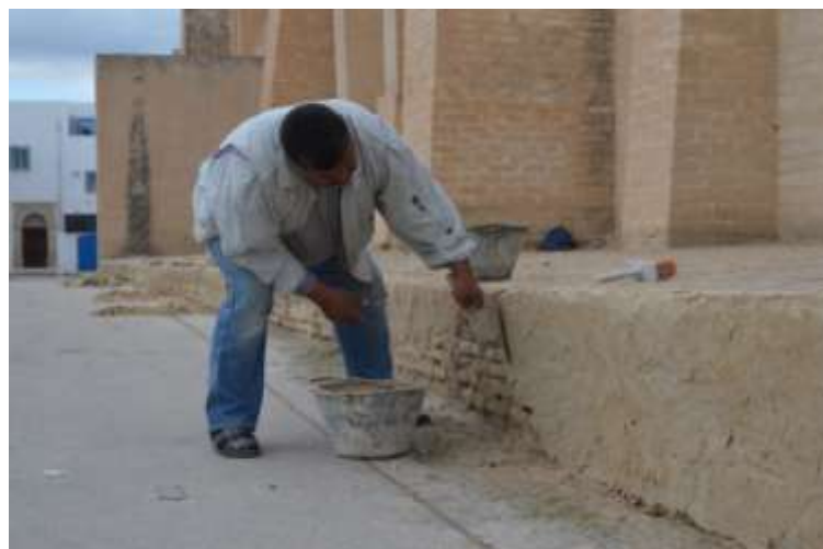
تركيز الملاط على محيط الجامع